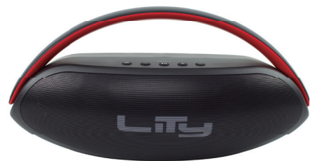
BLUETOOTH SPEAKER OWI B12

Recomenda-se ler atentamente este manual do usuário e guardá-lo para referência futura.