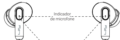
Indicador de microfone